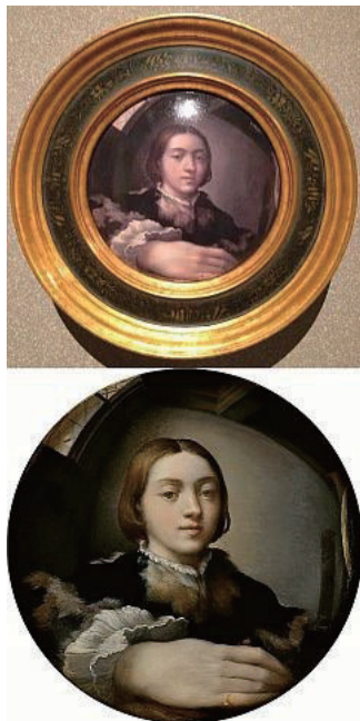
図2 パルミジャーニョ「凸面鏡の自画像」(1523~24年)

道具として使用される平面鏡は, 金属製の円い鏡から始まりましたが, ガラス製の鏡では, 製造技術の関係で凸面鏡が先行しました。絵画の中に描かれる鏡については視覚とヒトの心とのかかわり, そして文学とのかかわりで大変多くの文書を見出すことができます。文献を1件 2) ご紹介します。凸面鏡は, 広大な世界の像をその上に映し出しますが, 一般の方の見方と, 結像光学について知識を持っている人との食い違いが分かる, 歴史的な資料があります。図2はマニエリスム初期の画家, パルミジャーニョ(1503~1540年)による, 凸面鏡に映った自画像です。この絵画には特別な工夫があります。凸面上に描かれていて, 凸面鏡ではその表面上に像があるように感じることを反映, 観賞者の共感を呼ぶ大変優れた創作物です。図2の上側は, 表面反射が分かるよう撮影しています。