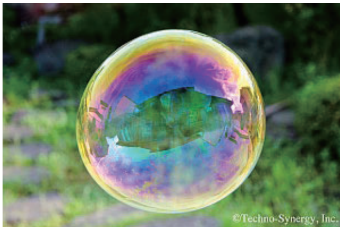
図5 シャボン玉の写真

ここで改めて、シャボン玉の像に向かいたいと思います。図5は、物理現象を美しい写真に記録する専門家、(有)テクノ・シナジーの田所利康氏に提供いただいた写真です。