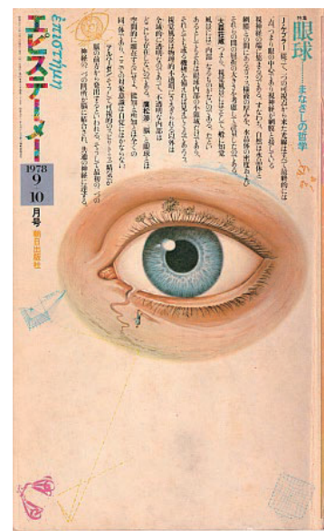
図1 “エピステーメー”の表紙

図1は月刊思想雑誌“エピステーメー”1978年9+10月号 1) の表紙です。前回は掲載スペースの関係で今回ご紹介することになりました。典型的なキャッチライトが描かれています。タレントなどの人物写真では, 単一のキャッチライトが普通なので, この図で改めて確認いただきたいと思います。この号は大変示唆に富んでいてすべて紹介したいのですが, 代わりに目次の一部を転載します。特集=眼球 まなざしの哲学 I 哲学-視覚と認識/世界の眺め/現象学的に「見る」ということ小考/視覚的世界像の罪障 II 光学-視覚と視像/目の構造(アルハーゼン)/視覚論(ヨハネス・ケプラー) III 世界-触覚と視覚/觸覚的世界の成立/眼球モデルの二つの哲学。