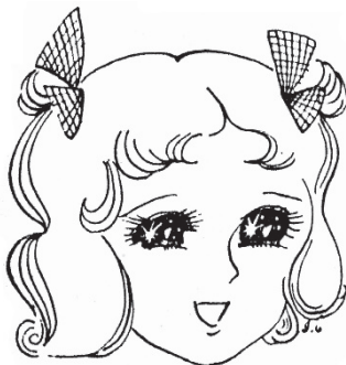
図1 少女漫画に見られるキラキラ輝く瞳 (小倉磐夫, 1976年11月 写真工業)

1976年10月20日のことでした。その日発売された“写真工業”誌を開き、大変強い印象を持ったことを覚えています。カメラドクターとも呼ばれていた小倉磐夫先生（1930～2000年）、当時東京大学教授によるイラストと説明 1) に出会いました。図1は、小倉先生による「少女漫画に見られるキラキラ輝く瞳」のイラスト、図2は眼球光学系の各面反射の模式図、プルキンエ＝サンソン像の説明です。写真工業誌の関係者の許可を得、転載させていただきました。また図2は分かりやすくするため上下反転しトレースしています。いつもはカメラの機構図を描いている小倉先生は画家になりたかったのだというエピソードから納得できます。このイラストには先生の I. O. というサインが書き込まれています。なおスチル写真や動画撮影では、光源やレフ板の形が瞳に映り込むことを利用、キャッチライトと呼ばれ表情の演出に利用されています。