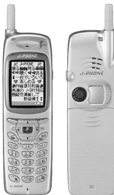
図 1 J-SH04 (2000 年)

携帯電話からスマートフォンに軸足を移してからカメラの高画素化・高画質化の流れは止まることはなく、また多眼化も進んでいる。これはサイズの制約上光学ズーム機能を搭載することが難しいため、単焦点カメラを複数搭載（例えば 13mm，26mm，76mm 等）し多眼化することで擬似的に光学ズームを実現できるからである。