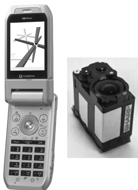
図 2 V602SH (2004 年)(左) 光学 2 倍カメラモジュール(右)